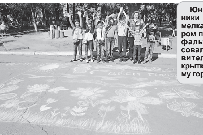
Юные художники цветными мелками, на сером полотне асфальта, нарисовали поздравительную открытку любимому городу.