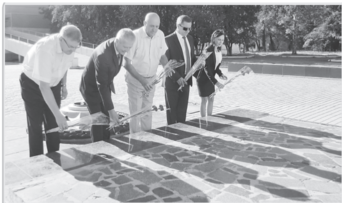
Возложение руководителями города цветов к памятнику «Клятва» и месту захоронения юных подпольщиков – обязательная дань памяти «Молодой гвардии» на каждом знаковом событии в Краснодаре.