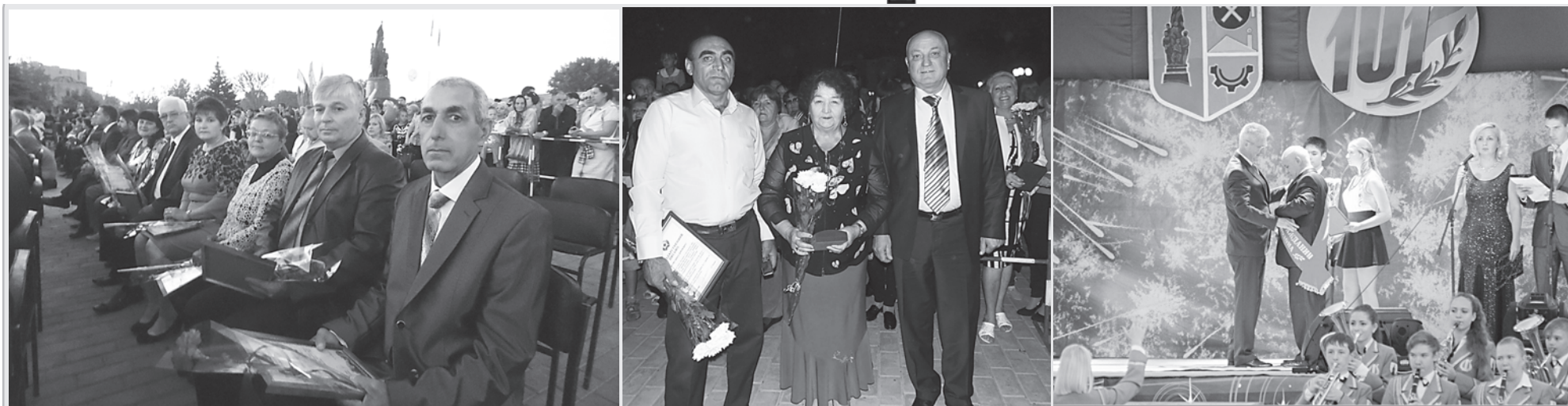
НАГРАДЫ ПОЛУЧИЛИ САМЫЕ ДОСТОЙНЫЕ И ЗАСЛУЖЕННЫЕ КРАСНОДОНЦЫ