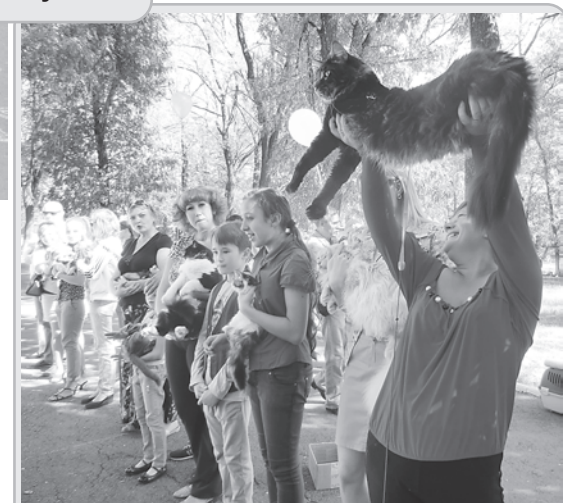
Победитель Диксон весит восемь (!) килограммов