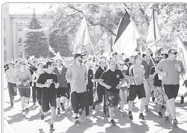
Краснодонская молодежь выступила инициатором проведения пробежки по городу - с флагами, речевками. «Краснодон выбирает спорт», - скандировали они во время бега.