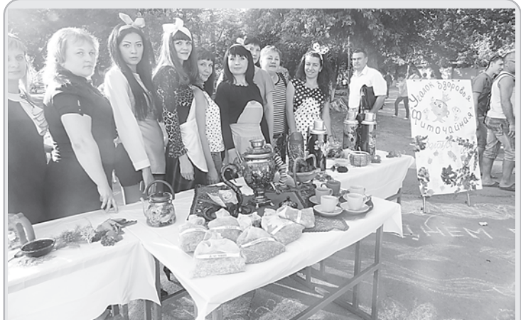
Не только о пище духовной для краснодонцев позаботились организаторы праздника. Вкусный кулеш предлагался всем желающим у «буфетной стойки» полевой кухни, а обаятельные сотрудницы Краснодарского терцентра угощали земляков ароматным чаем, настоящим на травах.