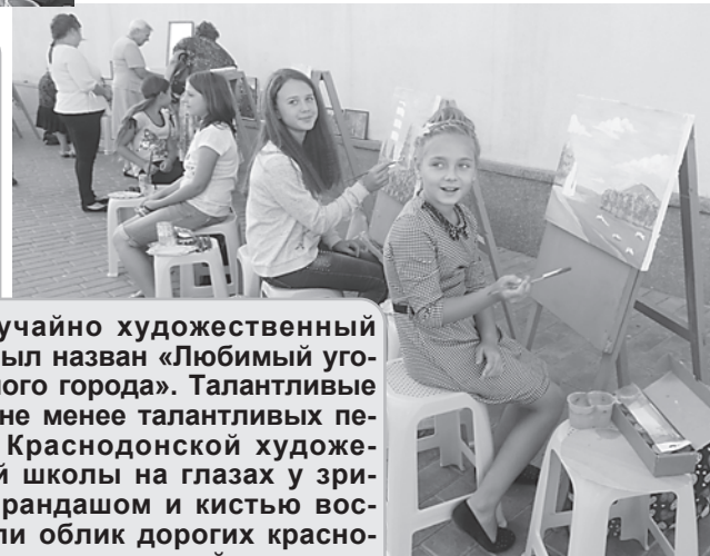
Не случайно художественный пленэр был назван «Любимый уголок родного города». Талантливые ученики не менее талантливых педагогов Краснодарской художественной школы на глазах у зрителей карандашом и кистью воссоздавали облик дорогих краснодонцам улиц, площадей, скверов.