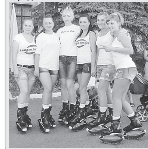
Умницы, красавицы, спортсменки! Впервые «Кенго клуб Краснодар №1» блистал на празднике города.