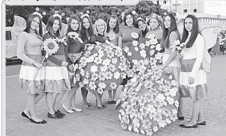
Многолюдно было в сквере имени Никитенко, где свои визитные карточки, как всегда зрелищно и неординарно, представляли школы города.