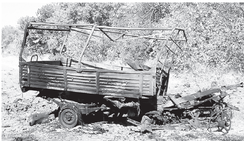
Все, что осталось от УАЗА охранения

На тот момент нацгвардейцы занимали стратегически важную позицию за Каменкой. Здесь враг расположил свои склады с боеприпасами и рассредоточил тяжелое вооруже-