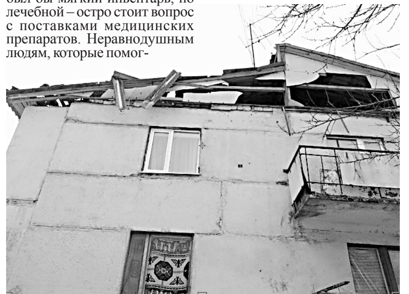
Во время бомбежки хозяев, к счастью, не было дома

Во втором мосту, ведущем к Луганску, зияет большая дыра. Проехать, конечно, еще можно, но с большим риском. Перевозчики курсируют, как вздумается, не соблюдая графика. И, в общем-то, понять их можно. Безопасность для людей дороже заработка. Так что, выезжая из села, его жители, в основном, рассчитывают на личный транспорт и