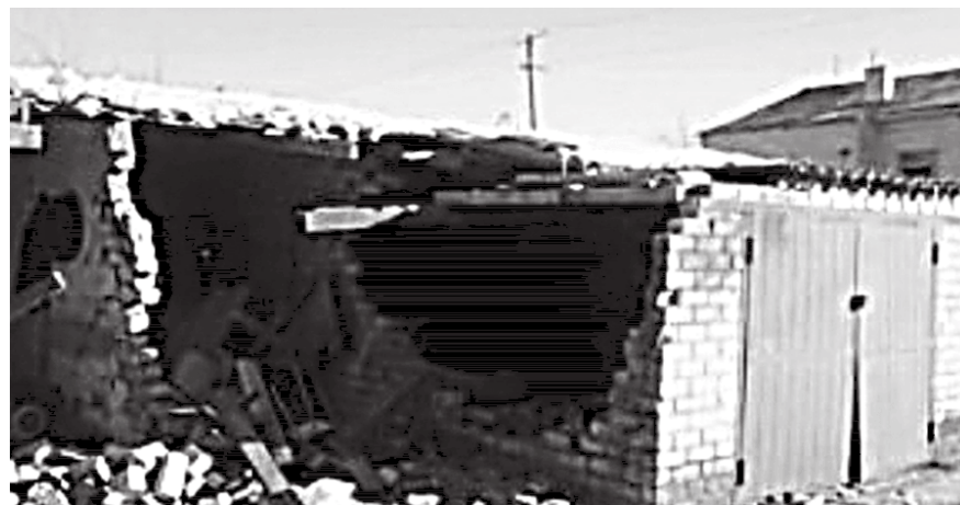
В дачном массиве нет «живого» места

Самые маленькие селяне сейчас сидят по домам. Уже больше недели учреждения образования в Николаевке не работают. Во время последнего обстрела артиллерия ВСУ зацепила местную школу. Около здания приземлились четыре снаряда, в части помещений вылетели окна. Все разрушения в Николаевке на данный момент подытожить нереально, настолько они глобальные. Но по мере возможности такая работа в сельсо-