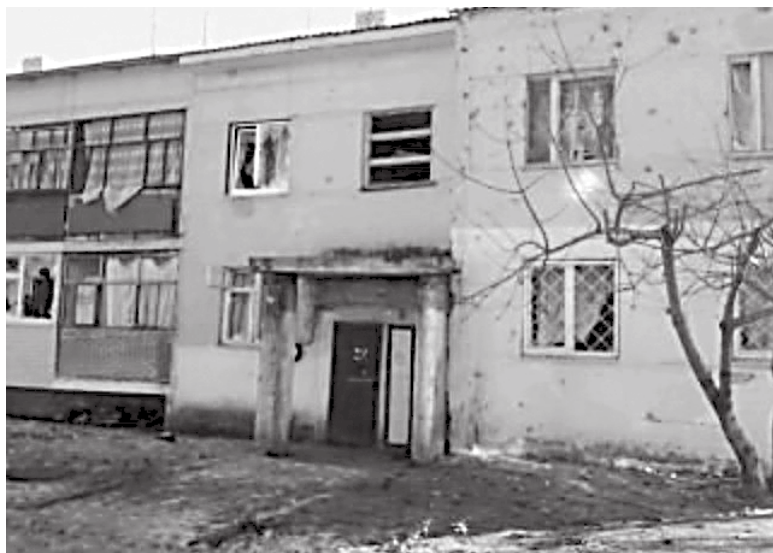
Весь фасад двухэтажки побит «градом»

делают крюк через Новосветловку в качестве дополнительной страховочной меры. Выбраться в город чаще всего стараются за продуктовым запасом. До недавнего времени в местных магазинах было все необходимое. Но с возобновлением обстрелов и началом экономической блокады Донбасса ситуация изменилась – полки стали стремительно пустеть. Правда, для очень многих в Николаевке это – совсем не проблема. Независимо от ассортимента, у народа не за что купить даже самое необходимое. Бюджетники Николаевки зарплату не получали уже семь месяцев. Чтобы как-то им помочь, сельсовет сейчас готовит ходатайство перед руководством ЛНР о предоставлении особо нуждающимся гуманитарной помощи.